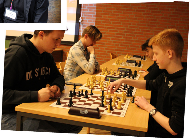
In a while, crocodile :)